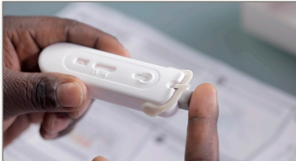
ภาพบน: การเจาะเลือดจากปลายนิ้วมือสำหรับชุดตรวจเอชไอวีด้วยตนเองชนิดตรวจจากตัวอย่างเลือด ภาพขวามือ: ภาพวาดสาธิตการตรวจเอชไอวีด้วยตนเองชนิดที่ตรวจจากของเหลวในช่องปาก

อย่างไรก็ตามยังมีประเด็นสำคัญเกี่ยวกับชุดตรวจเอชไอวีด้วยตนเองหลายประการที่ยังไม่มีข้อสรุปที่ชัดเจนและจำเป็นที่จะต้องมีการปรึกษาหารือกันอย่างต่อเนื่องต่อไป