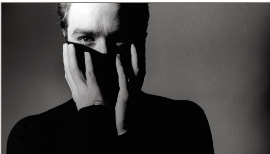
สำหรับคนส่วนใหญ่ที่ไม่เกี่ยวข้องกับการทำงานด้านเอชไอวีโดยตรง การติดเอชไอวีเป็นเรื่องร้ายแรงและรุนแรงมาก ดังเช่นข่าวเกี่ยวกับเอชไอวีโดย CNN ที่พาดหัวข่าวว่า When HIV is a death sentence (เมื่อเอชไอวีคือคำพิพากษาประหารชีวิต)

ถึงแม้ว่าแพทย์สภาจะมีความเห็นว่าเด็กอายุ 18 ปีสามารถตรวจเอชไอวีได้โดยไม่ต้องมีความยินยอมจากผู้ปกครองก็ตาม แต่กรณีนั้นหมายถึงการตรวจเอชไอวีโดยบุคลากรทางการแพทย์ที่เป็นส่วนหนึ่งของระบบดูแลสุขภาพและป้องกันที่เกี่ยวกับเอชไอวีทั้งหมดซึ่งมีระบบรองรับทั้งด้านป้องกันและดูแลสุขภาพพร้อมอยู่แล้ว และมีการบันทึกเป็นหลักฐานทำให้การติดตามเฝ้าระวังและประเมินผลสามารถทำได้ แต่ชุดตรวจเอชไอวีด้วยตนเองไม่มีหลักประกันว่าผู้ตรวจจะได้รับการส่งต่อไปยังบริการที่เหมาะสมแต่อย่างใด