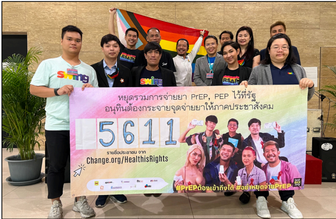
กลุ่มนักกิจกรรมจากชุมชนประท้วงการยกเลิกบริการเพร็พของรัฐบาลที่รัฐสภาไทย

รัฐบาลไทยได้ยุติการให้บริการป้องกันเอชไอวีก่อนสัมผัสเชื้อ (หรือ เพร็พ) ที่เป็นบริการชั้นนำของประเทศ ซึ่งการกระทำดังกล่าวเป็นอันตรายต่อแนวทางการทำงานที่ได้รับความสนใจจากนานาชาติเป็นอย่างมาก และเป็นหัวใจสำคัญของโครงการเพร็พที่ใหญ่ที่สุดในเอเชีย